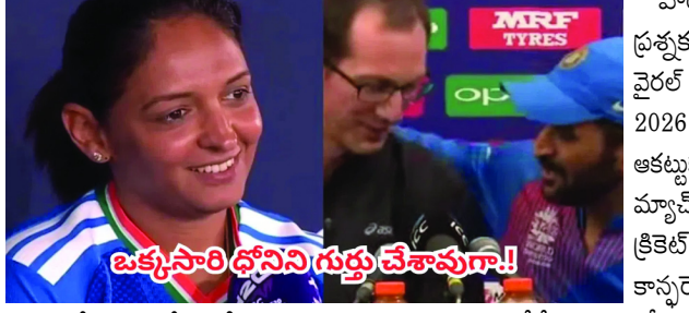
ఒక్కసారి ధోనీని గుర్తు చేశామనా!

సోషల్ మీడియాలో విపరీతంగా ట్రెండ్ అవుతున్నాయి. ఐసీసీ ఉమెన్స్ టీ20 వరల్డ్ కప్ 2026 ప్రెస్ మీట్ లో ఒక జర్నలిస్ట్ అడిగిన రిటైర్మెంట్ ప్రశ్నకు ఆమె ఇచ్చిన అదిరిపోయే రిపై అందరినీ ఆశ్చర్యపరిచింది. ఈ సమాధానం చూసిన నెటిజన్లు, క్రికెట్ ఫ్యాన్స్.. గతంలో మాజీ కెప్టెన్ ఎంఎస్ ధోనీ ప్రెస్ మీట్ లో చేసిన హాల్ చలన గుర్తు చేసుకుంటున్నారు. ఈ ఏడాది ఉమెన్స్ టీ20 వరల్డ్ కప్ టోర్నమెంట్ జూన్ 12 నుంచి జూలై 5 వరకు ఇంగ్లాండ్, వేల్స్ వేదికగా జరగనుంది. ఈసారి సరికొత్తగా మొత్తం 12 జట్లు ఈ మెగా టోర్నీలో తలపడబోతున్నాయి. వీటిని రెండు గ్రూపులుగా విభజించారు. ప్రతి గ్రూప్ లో ఆరు జట్లు ఉంటాయి. లీగ్ దశలో ప్రతి జట్టు ఐదు మ్యాచ్ లు ఆడుతుంది. ఆ తర్వాత రెండు గ్రూపుల నుంచి టాప్-2 లో నిలిచిన జట్టు సెమీఫైనల్ కు అర్హత సాధిస్తాయి.