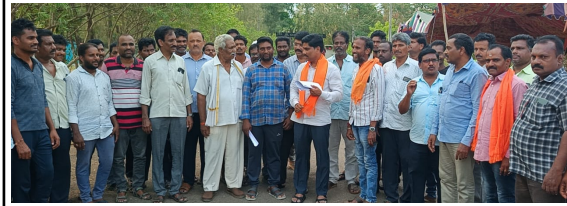
కడియం, విశ్వం వాయిస్ న్యూస్ : ముందు కుదిరిన జీతాల ఇంక్విజిషన్ అగ్రిమెంట్ ప్రకారం 2023 జనవరి నుంచి జీతాలు పెంచాల్సి ఉండగా.. నిర్లక్ష్యం వహిస్తూ కార్మికుల జీతాలతో అడుకుంటూ జీతాలు పెంచని ఆంధ్ర