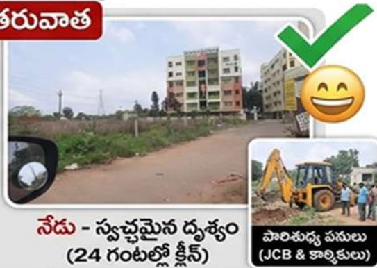
నేడు - స్వచ్ఛమైన దృశ్యం (24 గంటల్లో క్లీన్)