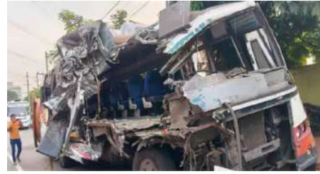
గాయాలయ్యాయి. క్షతగాత్రులను విశాఖ కేజీహెచ్ కేంద్రంలో చికిత్స అందిస్తున్నారు. గాజువాక పోలీసులు కేసు నమోదు చేసి దర్యాప్తు చేపట్టారు.

విశాఖపట్నం, విశ్వం వాయిస్ స్టూప్ : గాజువాకలోని శ్రీనగర్ వద్ద ఇవాళ ఉదయం జరిగిన రోడ్డు ప్రమాదంలో ముగ్గురు మృతి చెందారు. రాజమహేంద్రవరం నుంచి రామభద్రాపురం వైపు వెళ్తున్న ఆర్టీసీ బస్సు ఆగిఉన్న లారీని ఢీకొట్టడంతో ఈ ప్రమాదం జరిగింది. ఈ ఘటనలో ఇద్దరు మహిళలు, ఒక డ్రైవర్ మృతిచెందగా, ఏడుగురుకి గాయాలయ్యాయి. క్షతగాత్రులను విశాఖ కేజీహెచ్ కేంద్రంలో చికిత్స అందిస్తున్నారు. గాజువాక పోలీసులు కేసు నమోదు చేసి దర్యాప్తు చేపట్టారు.