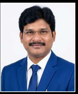
ఎడిటర్ : కె.సుధీర్ కుమార్

పెద్దలుగా ఉంటానే : ఈ విధంగా ఆరేళ్ళ పాటు ఎమ్మెల్యే పదవీ కాలం సీనియర్ల అనుభవానికి తగినట్లుగా ఇవ్వారు అని అంటున్నారు దాంతో వారు విలువైన సూచనలు సలహాలు మండలిలో ఇవ్వడం ద్వారా ప్రభుత్వానికి మేలు చేసి విధంగా దోహదపడతారు అని అంటున్నారు. ఇలా సీనియర్లను మండలికి సర్దుబాటు చేయడం ద్వారా ఆయా నియోజకవర్గాలలో కొత్త ముఖాలను యువతను ప్రోత్సహించాలని టీడీపీ డిస్టెండ్ అయింది అని అంటున్నారు. మొత్తం మీద చూసుకుంటే కొత్త నీరు వచ్చి పాత నీరుని నెట్టేయడం కామన్ అయినా టీడీపీ మాత్రం సీనియర్లను గౌరవించాలనే చూస్తోంది అని అంటున్నారు అలా సీనియర్లకు భారీ ఊరట దక్కబోతోంది అని అంటున్నారు.