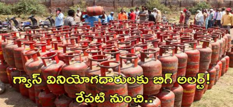
గ్యాస్ వినియోగదారులకు బిగ్ అలర్ట్! రేపటి నుంచి..

దేశవ్యాప్తంగా పీఎన్జీ వినియోగాన్ని పెంచేందుకు ప్రభుత్వం కొత్త నిబంధనలను అమలు చేస్తోంది. ఇప్పటికే పీఎన్జీ కనెక్షన్ ఉన్న గృహాలు ఎల్పీజీ కనెక్షన్ సులభం చేసుకోవాలి రావచ్చు, రీఫిల్ పరిమితులు, లాక్-ఇన్ వ్యవధి పెంపు, కొత్త కనెక్షన్ నిబంధనలు జూన్ నుంచి అమల్లోకి వచ్చే అవకాశాలు ఉన్నాయి. దేశంలో పైవీజీ నేచురల్ గ్యాస్ వినియోగాన్ని ప్రోత్సహించేందుకు ప్రభుత్వం చర్యలను వేగవంతం చేస్తోంది. వంటగ్యాస్ వినియోగంలో ఎల్పీజీపై ఆధారపడుతున్న కుటుంబాలను క్రమంగా పీఎన్జీ వైపు మళ్లించేందుకు కొత్త నిబంధనలను అమలు చేయాలని భావిస్తోంది. ఈ నేపథ్యంలో జూన్ నెల నుంచి గ్యాస్ వినియోగదారులపై ప్రభావం చూపే పలు మార్పులు