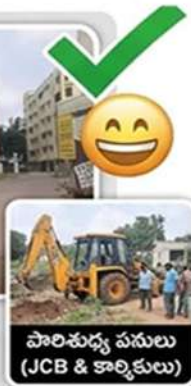
పారిశుధ్య పనులు (JCB & కార్మికులు)