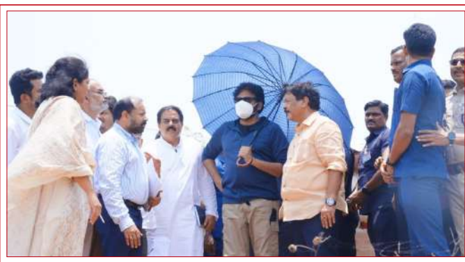
రాజమహేంద్రవరం, విశ్వం వాయిస్ ప్రత్యేక కథనం