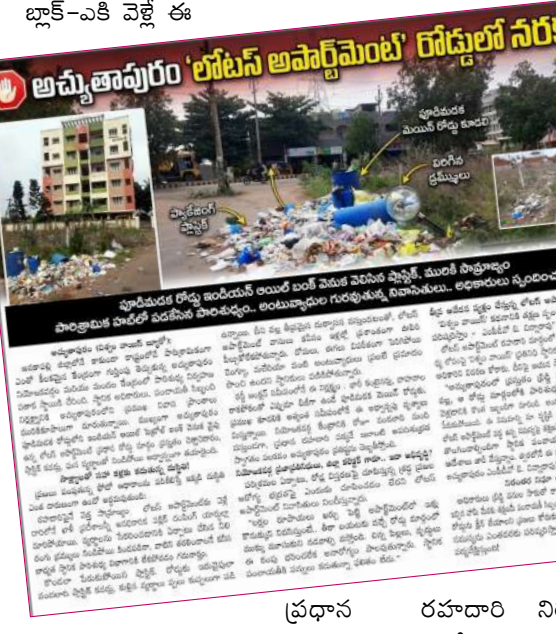
పూడిమడక రోడ్డు ఇండియన్ ఆయిల్ బంక్ వెనుక వైపు గల లోటస్ అపార్ట్‌మెంట్‌ల ప్రధాన రహదారి మార్గంలో పేరుకుపోయిన ప్లాస్టిక్ వ్యర్థాలు, అధ్వాన్నపు చెత్త కుప్పలు.

అచ్యుతాపురం, విశ్వం వాయిస్ ప్రతినిధి న్యూస్ : సమస్యలను వెలికితీయడమే కాదు.. వాటి పరిష్కారం వరకు బాధ్యతగా పనిచేస్తుందిని 'విశ్వం వాయిస్' మరోసారి నిరూపించింది. అసకాపల్లి జిల్లా అచ్యుతాపురం నియోజకవర్గం/మండల కేంద్రంలోని పూడిమడక రోడ్డు, ఇండియన్ ఆయిల్ పెట్రోల్ బంక్ వెనుక వైపు గల లోటస్ అపార్ట్‌మెంట్‌ల ప్రధాన రహదారి మార్గంలో పేరుకుపోయిన ప్లాస్టిక్ వ్యర్థాలు, అధ్వాన్నపు చెత్త కుప్పలపై బుధవారం నాటి సంచిత ప్రచురించిన ప్రత్యేక బుధవారం కథనానికి అధికార యంత్రాంగం తక్షణమే స్పందించింది.