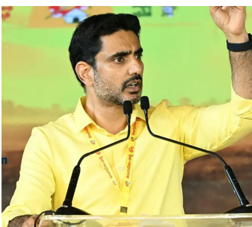
మంత్రి లోకేష్ ప్రకటించడం ఆసక్తికర చర్యగా మారినది అంటున్నారు. మహానాడు వేదికగా జెన్ ఆల్ఫా జీతోపాటు జెన్ ఆల్ఫా కోసమూ తాము పనిచేస్తున్నామని, వారికి గొప్ప అవకాశాలు ఉన్నాయని లోకేష్ ప్రకటించారు.

తెలుగుదేశం పార్టీ వార్షిక పండుగ మహానాడు తొలిరోజు ఒక సృష్టమైన రాజకీయ దిశను చూపెట్టినదనే చర్చ జరుగుతోంది. పసుపు పండుగ వేదికగా టీడీపీ కేవలం ప్రస్తుత రాజకీయాల గురించే మాట్లాడటానికే పరిమితం కాకుండా, రాబోయే తరాలను దృష్టిలో పెట్టుకుని విజన్ పాలసీకి సిద్ధమవుతున్నట్లు సంతకాలిచ్చింది అంటున్నారు.