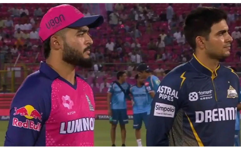
అంతకుముందు, రాజస్థాన్ తరపున వైభవ్ చేయగా, అందులో ఎనిమిది ఫోర్లు, ఏడు సిక్సర్లు సూర్యవంశీ 47 బంతుల్లో 96 పరుగులు ఉన్నాయి. రవీంద్ర జడేజా కూడా 45 పరుగులతో

గుజరాత్ టైటాన్స్ మూడోసారి ఐపీఎల్ ఫైనల్ కు చేరుకుంది. క్యాలిఫర్నియా 2లో ఈ జట్టు రాజస్థాన్ రాయల్స్ ను 7 వికెట్ల తేడాతో ఓడించింది. మే 31న అహ్మదాబాద్ లో జరిగే ఫైనల్ లో గుజరాత్, రాయల్ ఛాలెంజర్స్ బెంగళూరుతో తలపడనుంది. గుజరాత్ టైటాన్స్ మూడోసారి ఐపీఎల్ ఫైనల్ కు చేరుకుంది. క్యాలిఫర్నియా 2లో ఈ జట్టు రాజస్థాన్ రాయల్స్ ను 7 వికెట్ల తేడాతో ఓడించింది. మే 31న అహ్మదాబాద్ లో జరిగే ఫైనల్ లో గుజరాత్, రాయల్ ఛాలెంజర్స్ బెంగళూరుతో తలపడనుంది. శుక్రవారం ముల్లన్ పూర్ లోని మహారాజా యాదవేంద్ర సింగ్ స్టేడియంలో మొదట బ్యాటింగ్ చేసిన రాజస్థాన్ 20 ఓవర్లలో 6 వికెట్ల నష్టానికి 214 పరుగులు చేసింది. దీనికి సమాధానంగా, గుజరాత్ 18.4 ఓవర్లలో 3 వికెట్ల నష్టానికి లక్ష్యాన్ని చేరుకుంది.