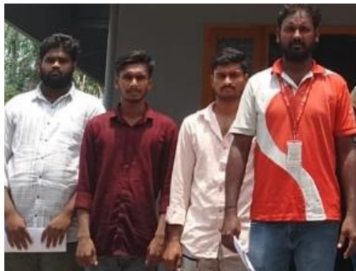
పైబర్నెట్ విభాగానికి ముగ్గురు యువకులు