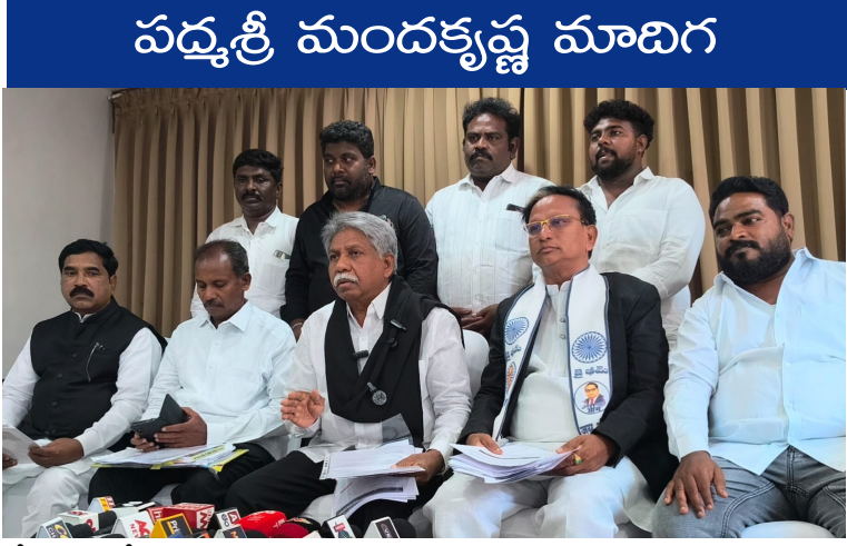
పద్మశ్రీ మందకృష్ణ మాదిగ

రాజమహేంద్రవరం, విశ్వం వాయిస్ న్యూస్ : దళిత క్రైస్తవుల అంతం పై వారి ఆర్థిక, సామాజిక అంశాలపై అధ్యయనం చేయడానికి కే.జి.బాలకృష్ణ కమిటీ గడువు మరో 3 నుండి 6 నెలలకు పొడిగించాలని మాదిగ రిజిస్ట్రేషన్ పోరాట సమితి వ్యవస్థాపక అధ్యక్షుడు పద్మశ్రీ మంద కృష్ణ మాదిగ అన్నారు. శుక్రవారం రాజమహేంద్రవరం స్థానిక ప్రైవేట్ హోటల్లో ఏర్పాటు చేసిన విలేకరుల సమావేశంలో ఆయన మాట్లాడుతూ కేంద్ర ప్రభుత్వం 2022లో అధ్యయనం చేయడానికి అక్టోబర్లో కే.జి.బాలకృష్ణ కమిషన్ ఏర్పాటు చేసింది. తెలిపారు. మరో 10 రోజులు గడువు మాత్రమే కమిషన్ కి ఉందని చెప్పిన కే.జి.బాలకృష్ణ గతంలో గడువు కావాలని ఎలా అయితే కోరాలో, అలాగే మరో 6 నెలలు పొడిగించాలని కోరాని డిమాండ్ చేశారు. కేంద్రం ప్రభుత్వం సైతం అభ్యర్థన మన్నించాలని కోరారు. దళిత క్రైస్తవుల కమిషన్ అన్ని దళితులు మతం మార్చుకున్న సామాజికంగా, వెనుకబడినవారి కోసం గతంలో 2005 కాబట్టి ఎన్నీగా గుర్తించాలని సవరణ తీసుకురావాలని గత కమిషన్లు తెలియ