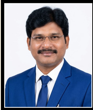
ఎడిటర్ : కె.సురేశ్ కుమార్

వైసీపీ పాయింట్లు ఇవే : అయితే ముందుగా వైసీపీ అభ్యర్థులను ప్రకటించడం వల్ల ఇబ్బందులు కూడా ఉన్నాయని అంటున్నారు. అది కూడా మూడేళ్లకు ముందే ప్రకటించడం వల్ల ఆయా చోట్ల కూటమికి చాన్స్ ఇచ్చినట్లు అవుతుందని అంటున్నారు. వారు వీరిని మించిన వారిని బలవంతులను రంగంలోకి దింపితే అప్పుడు వైసీపీకి ఇబ్బంది అవుతుందని కూడా అంటున్నారు. అంతే కాదు వైసీపీ అభ్యర్థులను చూసి అన్ని విధాలుగా మెరుగైన అభ్యర్థులను కూటమి పార్టీలు సెలెక్ట్ చేసుకోవడానికి ఒక గోల్డెన్ చాన్స్ గా ఇది ఉపయోగపడుతుందని అంటున్నారు. మరో వైపు చూస్తే సాంత పార్టీలోనే ఈ నిర్ణయం వల్ల చాలా మంది ఆశాపరులు డీలా పడిపోవచ్చు అని వారు మూడేళ్లకు ముందే వైసీపీని వీడి ఇతర పార్టీలలో చేరేందుకు యత్నించవచ్చు అని అది వైసీపీకి బాహురంగం అవుతుందని కూడా అంటున్నారు. అయితే ఈ ముందస్తు ప్రయోగం మీద వైసీపీలో అయితే ఇంకా తర్జన భర్జన పడుతున్నారు కానీ నిర్ణయానికి రాలేదని అంటున్నారు. చూడాలి మరి ఈ ప్రచారం ఏ విధంగా ముందుకు సాగుతుంది.