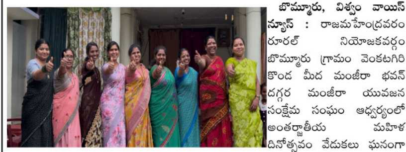
బోమ్మూరు, విశ్వం వాయిస్ న్యూస్ : రాజమహేంద్రవరం రూరల్ నియోజకవర్గం బోమ్మూరు గ్రామం వెంకటగిరి కొండ మీద మంజీరా భవన్ దగ్గర మంజీరా యువజన సంక్షేమ సంఘం ఆధ్వర్యంలో అంతర్జాతీయ మహిళా దినోత్సవం వేడుకలు ఘనంగా నిర్వహించారు. మహిళల అభ్యున్నతికి అందరూ కలిసికట్టుగా కృషి పనిచేయాలని మంజీరా సేవా సమితి మహిళా సభ్యులు అన్నారు. ముందుగా కేక్ కట్ చేసి వారి ఆనందాన్ని పంచుకున్నారని రూరల్ బోమ్మూరు మహిళా దినోత్సవ కార్యక్రమాన్ని ప్రతి ఎత్తున నిర్వహిస్తానని సంఘ సభ్యులు తెలియజేశారు.

మంజీరా యువజన సంక్షేమ సంఘం ఆధ్వర్యంలో మహిళా దినోత్సవం ఘనంగా