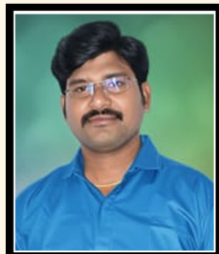
ఎడిటర్ : కె.సునీల్ కుమార్

అయినా పశ్చిమం గెలుచుకునేందుకు పీలు ఉంటుందని మహిళా కార్మికుల పాటు విక్రీమ్ కార్డు కూడా పండుతుందని వైసీపీ లో అయితే ప్రచారంగా ఉంది. దీని మీదనే సోషల్ మీడియాలో చర్చ అయితే సాగుతోంది. చూడాలి మరి ఏమి జరుగుతుందో.