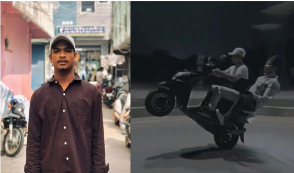
పరిస్థితి విషమంగా ఉండటంతో అతనిని మెరుగైన వైద్యం కోసం బెంగుళూరు తరలించి నట్లు సమాచారం.. పోలీసులు నిత్యం నిఘా పెట్టినా.. డ్రోన్ లతో సెల్ఫీ చేస్తున్నా.. ఇలాంటి వారు మాత్రం.. రోడ్లపై హాల్ చలో చేస్తూనే ఉన్నారు. అయితే, తల్లి దండ్రులు తమ పిల్లలపై దృష్టి పెట్టాలని.. అలాగే.. పోలీసులు రీల్స్ చేసే యువతకు కౌన్సిలింగ్ ఇవ్వాలి అవసరం ఉందని స్థానికులు పేర్కొంటున్నారు.