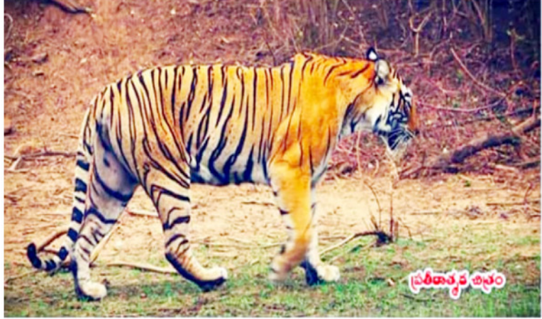
తూర్పుగోదావరి జిల్లా గాడాల, కోలమూరు సమీపంలోని పంటపొలాల్లో పులి

సంచారం అక్కడి ప్రజలను కంటిమీద కునుకు లేకుండా చేస్తోంది. పొలాలకు వెళ్లాలంటే రైతులు, రైతు కూలీలు భయపడుతున్నారు. పులి జాడను కనిపెట్టేందుకు రంగంలోకి దిగిన అటవీశాఖ అధికారులు పంట పొలాల మధ్య పెద్దపులి పాదముద్రలను గుర్తించారు. గత మూడు రోజులుగా తొర్రేడు పంట పొలాల మధ్య ఉన్న పెద్దపులి... మూడు కిలోమీటర్ల దూరంలో ఉన్న కోలమూరు సమీప పంట పొలాల వైపు వచ్చినట్లు గుర్తించిన అధికారులు ప్రజలను రైతులను అప్రమత్తం చేస్తున్నారు. స్థానిక ఎమ్మెల్యే బత్తుల బలరామకృష్ణ ప్రజలను ఒంటరిగా పొలాలకు వెళ్ళవద్దని సూచించారు. అంతేకాదు, పెద్దపులి సంచారంతో సమీప స్కూళ్ళకు సెలవులు ప్రకటించారు అధికారులు. సాధారణంగా పెద్దపులి పగటిపూట బయటకు రాదని ప్రజలు భయపడవద్దని ఫారెస్ట్ అధికారులు చెబుతున్నారు. ప్రస్తుతం కోలమూరు చెరువు సమీపంలో ఒక కొబ్బరి చెట్టు కింద పెద్ద పులి పాదముద్రలను గుర్తించారు. రైతులు ఎవరూ పంట పొలాల వైపు వెళ్ళవద్దని హెచ్చరిస్తున్నారని ఫారెస్ట్ అధికారులు.