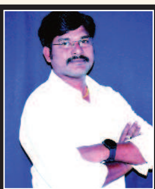
ఎడిటర్ : కె. సునీల్ కుమార్