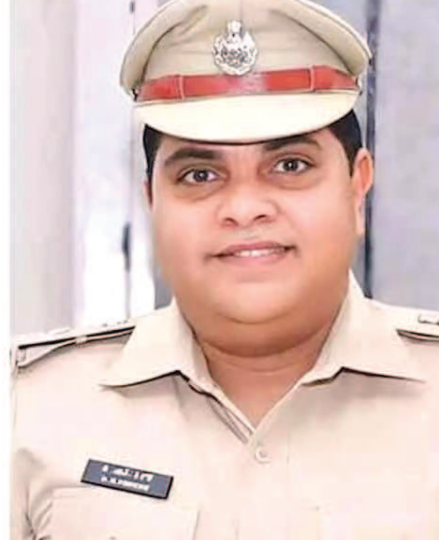
మంగళవారం ఉదయం తెల్లవారుజామున కొంతమూడు -ఆలోనగర్ మధ్య నయర పెట్రోల్ బంక్ ఎదురుగా హైవే ప్రక్కన ప్రముఖ క్రైస్తవ

సోషల్ మీడియాలో ప్రచురించవద్దు. పాస్టర్ మృతి పట్ల ప్రత్యేక బృందాలను ఏర్పాటు చేసి విచారణ కొనసాగిస్తున్నాం. విచారణ జరుగుతుంది త్వరలోనే నిజానిజాలను వెలికి తీస్తాం.