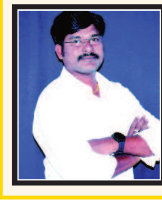
ఎడిటర్ : కె. సునీల్ కుమార్