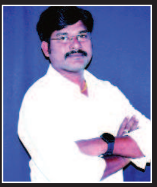
ఎడిటర్ : కె. సుధీర్ కుమార్