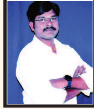
ఎడిటర్ : కె. సుబ్రహ్మణ్యం