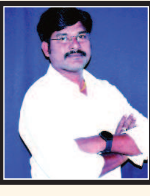
ఎడిటర్ : కె. సుబ్రహ్మణ్యం