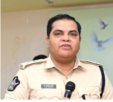
డ్రైవ్ మరియు ఓపెన్ డ్రింకింగ్ చేసిన వారిపై కేసులు పెడతామని, అట్టి వారిపై చట్ట ప్రకారం కఠిన చర్యలు తీసుకుంటామని, వారిని గౌరవ కోర్టు ముందు హాజరు పరుస్తామని తెలిపారు.