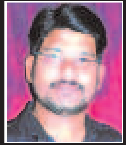
ఎడిటర్ : కె. సుబ్రహ్మణ్యం