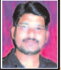
ఎడిటర్ : కె. సుబ్రహ్మణ్యం