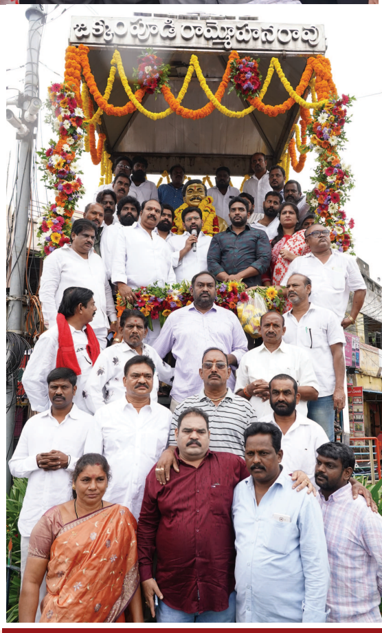
ప్రజాసేవలో జక్కంపూడి కి సాటిలేరు