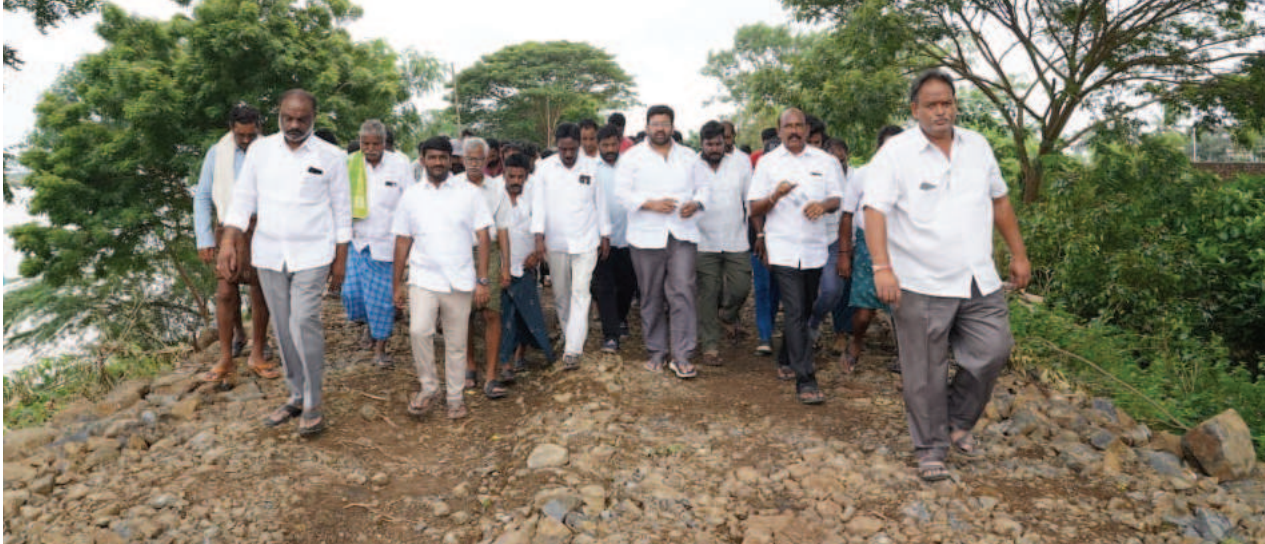
నాయుడు ప్రభుత్వం అధికారంలోకి వస్తే ప్రకృతి వైపరీత్యాల లేకపోతే వర్షాలు పడక పంట ఎండిపోతుందని నానుడి రాష్ట్రంలోనే రైతాంగంలో ఉందని అన్నారు. ప్రస్తుతం రాష్ట్రంలో ఇదే పరిస్థితి నెలకొందన్నారు. 50 ఏళ్ల క్రితం ఇలాంటి వరదలు వచ్చాయని రైతాంగం చెబుతున్నారని, గోదావరి వరద నీటిమట్టం పెరగడంతో