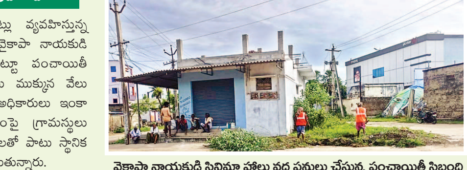
వైకాపా నాయకుడి సినిమా హాలు వద్ద పనులు చేస్తున్న పంచాయితీ సిబ్బంది

సాగిస్తున్నారు. ఇదంతా చూసి చూడనట్లు వ్యవహిస్తున్న పంచాయితీ అధికారులు మాత్రం చాగల్లు వైకాపా నాయకుడి సినిమా హాలు, షాపింగ్ కాంప్లెక్స్ చుట్టూ పంచాయితీ అధికారులు పనులు చేయటంతో స్థానికులు ముక్కు వేసి వేసుకున్నారు. కూటమి ప్రభుత్వం వచ్చిన అధికారులు ఇంకా వైకాపా నాయకులకు భజనలు చేయటంపై గ్రామస్థులు మండిపడుతున్నారు. దీనిపై ఉన్నత అధికారులతో పాటు స్థానిక నాయకులు దృష్టి సారించాలని పలువురు కోరుతున్నారు.