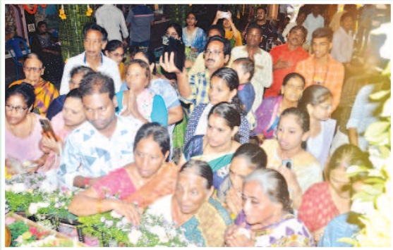
ఆర్యాపురం శ్రీ రాధాకృష్ణ మందిరంలో