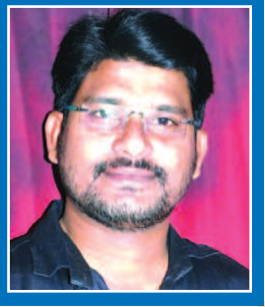
ఎడిటర్ : శ్రీ. స్రీనివాసరెడ్డి