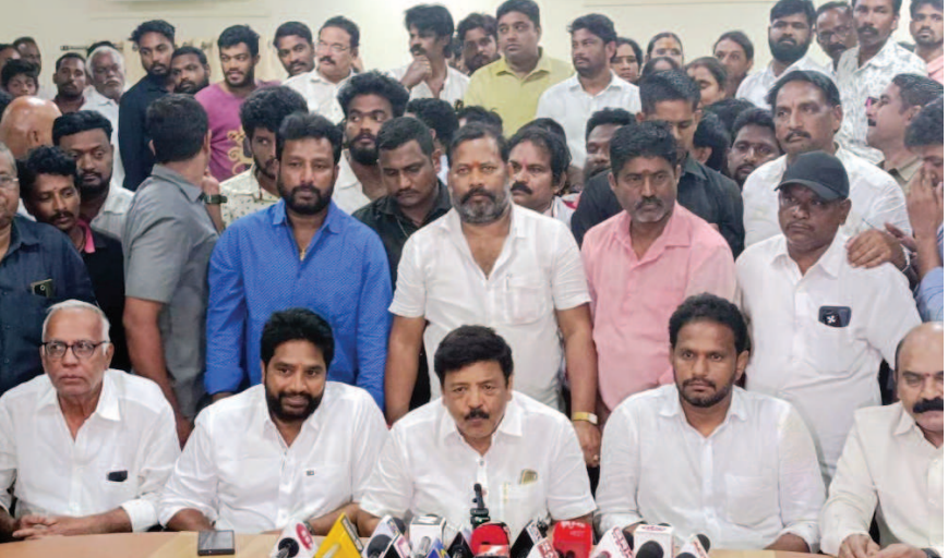
రాజమహేంద్రవరం, విశ్వం వాయిస్ న్యూస్ :