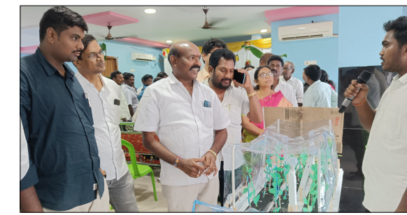
కొత్తపేట అలమూరు మే 27, విశ్వం వాయిస్ న్యూస్. వ్యవసాయంలో అధిక దిగుబడులు సాధించేందుకు రైతులు అందరూ