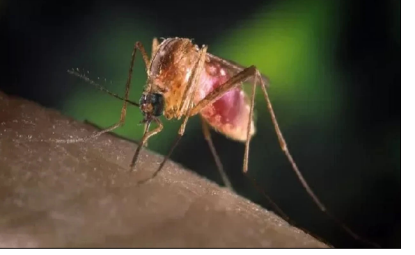
నుచిస్తున్నారు. ఇక రాష్ట్రంలో వెస్ట్ నెయిల్ ఫీవర్ వ్యాప్తి చెందడంతో ప్రజల్లో తీవ్ర ఆందోళనలు నెలకొన్నాయి. కొన్ని ప్రాంతాల్లో ఇంట్లోంచి బయటకు వెళ్లాలంటేనే జనం వణికిపోతున్నారు. ఈ భయాల నేపథ్యంలో కేరళ ఆరోగ్యశాఖ స్పందించింది. ఈ వెస్ట్ నెయిల్ ఫీవర్ రాష్ట్రంలో వ్యాప్తి

జతరు వృత్తి.. ఇలాంటి లక్షణాలుంటే అలర్ట్.. కేరళను వెస్ట్ నెయిల్ ఫీవర్ భయపెడుతోంది. ఈ ఫీవర్ తో ఇప్పటివరకు ఒకరు చనిపోవడం, మరో ఇరువై మంది ఆస్పత్రులో చికిత్స పొందుతుండటం అందోళన కలిగిస్తోంది. మరీ ముఖ్యంగా రాష్ట్రంలోని మూడు జిల్లాలలో% త్రిసూర్, మలప్పురం, కోజికోడ్ లో ఈ ఫీవర్ వ్యాప్తి ఎక్కువగా ఉండటంతో రాష్ట్రప్రభుత్వం అలర్ట్ అయ్యింది. ప్రతిఒక్కరూ అప్రమత్తంగా ఉండాలంటూ అధికారులు జాగ్రత్త చేశారు. వెస్ట్ నెయిల్ ఫీవర్ అనేది ఒక రకమైన వైరల్ జ్వరమంటున్నారా కేరళలోని ఆరోగ్య నిపుణులు. ఇన్ ఫెక్షన్ నోకిన క్యూరేట్స్ దోష ద్వారా ఈ ఫీవర్ మనుషులకు సోకుతుందని చెబుతున్నారు. ఈ వెస్ట్ నెయిల్ ఫీవర్ కు ఎలాంటి మందులు గానీ, టీకాలు గానీ లేవని పేర్కొన్నారు. ఈ వ్యాధి సోకిన వారికి ఉన్న లక్షణాలు ఆధారంగానే డ్రీట్ లో చేస్తారని చెబుతున్నారు. వెస్ట్ నెయిల్ ఫీవర్ సోకితూండటం ప్రతిఒక్కరూ ఆస్పత్రులకు వెళ్లాలని ప్రజలకు వైద్య నిపుణులు