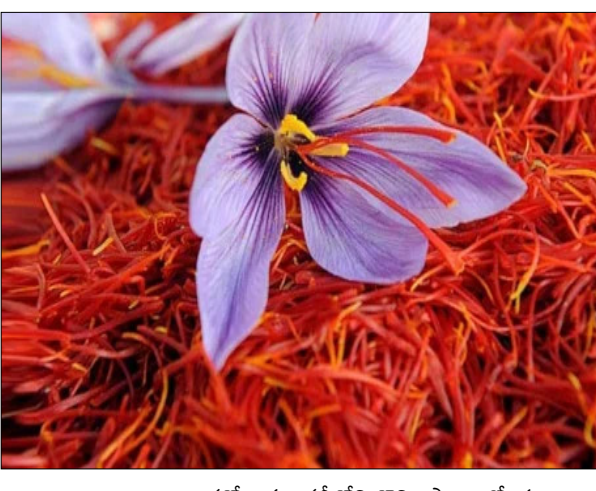
భారత్లో జమ్మూకశ్మీర్ లోని కొన్ని ప్రాంతాల్లో ఈ పంటను ఎక్కువగా పండిస్తారు. ప్రస్తుతం ఇక్కడ దీని ఉత్పత్తి

నవతెలంగాణ - హైదరాబాద్: సుగంధ ద్రవ్యాల రాధాణిగా పిలువబడే కుంకుమపువ్వు ఇజ్రాయెల్-గాజా యుద్ధం ఎఫెక్టివ్ తగిలింది. ప్రపంచవ్యాప్తంగా కుంకుమపువ్వు కొరత నేపథ్యంలో దీని ధర అమాంతం పెరిగింది. ప్రాణాళిత కలిగిన పువ్వు ధర రిటైల్ మార్కెట్ కి రూ.4.95 లక్షలుగా ఉంది. ఇది ప్రస్తుత బంగార ధర కంటే దాదాపు ఏడు రెట్లు ఎక్కువ. కుంకుమపువ్వు ఉత్పత్తిలో ఇరాన్ మొదటి స్థానంలో ఉంటుంది. ప్రపంచవ్యాప్తంగా పండే ఉత్పత్తిలో 90 శాతం ఇరాన్ నుంచే వస్తుంది. ఏటా అది 430 టన్నుల ఉత్పత్తి చేస్తుంది. అయితే గత కొన్ని నెలలుగా పశ్చిమాసియాలో కొనసాగుతున్న ఉద్రిక్తతల కారణంగా ఇరాన్ నుంచి కుంకుమపువ్వు సరఫరా తగ్గిపోయింది. దీంతో కోరత వలన దేశీయంగా ఉత్పత్తవుతున్న పంటకు డిమాండ్ పెరిగింది. ఫలితంగా మార్కెట్ మార్కెట్లో 20 శాతం, రిటైల్ అవుట్లెట్లలో సుమారు 27 శాతం ధరలు పెరిగాయి.