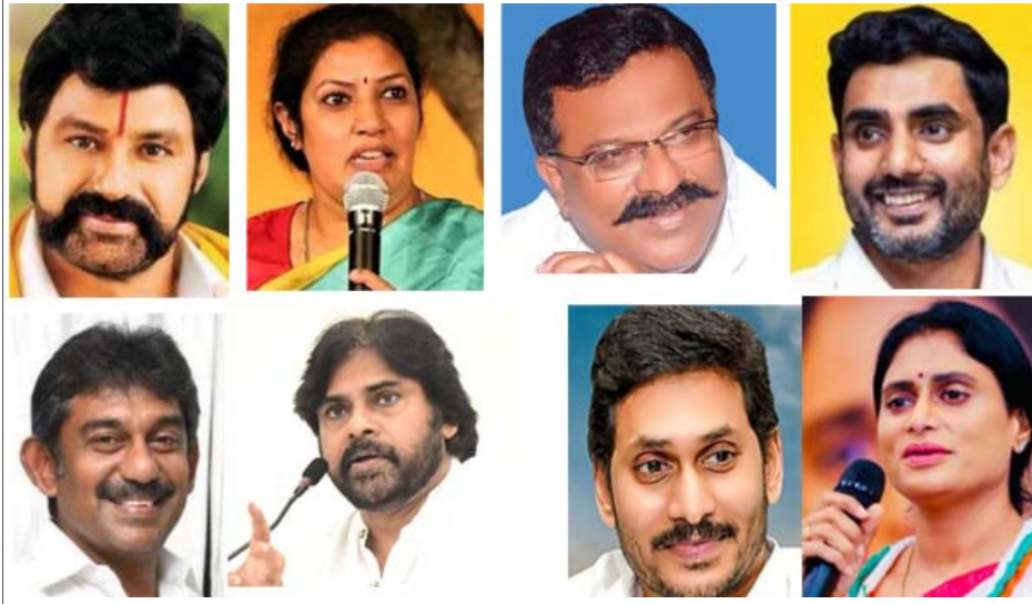
విశ్వం వాయిస్ దినపత్రిక:

సార్వత్రిక ఎన్నికలు రాష్ట్రంలో వచ్చే నెల 13న జరగనున్నాయి. ఉమ్మడి తెలుగు రాష్ట్రాలను పరిపాలించిన మాజీ ముఖ్యమంత్రిల తనయులు పలువురు 90%పార్లమెంట్, అసెంబ్లీ స్థానాలకు 8 మంది పోటీ చేస్తున్నారు. వీరు కాంగ్రెస్, బిజెపి, వైసిపి, టిడిపి, జనసేనల తరపున బరిలో ఉన్నారు. వారిలో మాజీ ముఖ్యమంత్రి కోట్ల విజయభాస్కర్ రెడ్డి తనయుడు, మాజీ కేంద్ర మంత్రి కోట్ల సూర్యప్రకాశ్ రెడ్డి కర్రులు జిల్లా డోన్ అసెంబ్లీ నియోజకవర్గం నుంచి టిడిపి