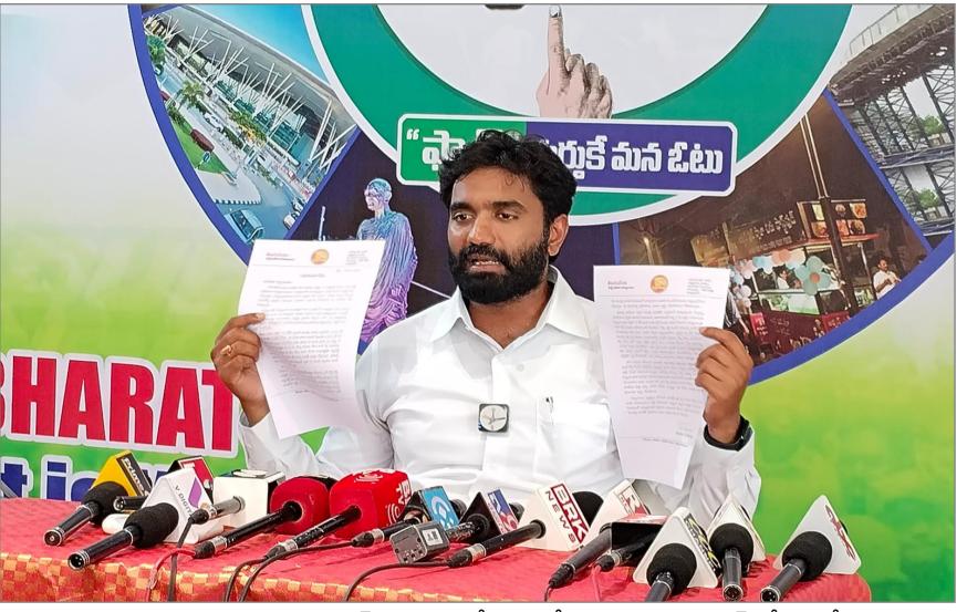
కమిషన్ ఉత్తర్వుల నేపథ్యంలో అవ్వతాతల పెన్షన్ కోసం రోజుల తరబడి నిరీక్షించాల్సి రావడం దురదృష్టకరం అన్నారు.

ఇప్పుడు వాలంటీర్ సేవలు టీడీపీకి తీవ్ర ఇబ్బంది కలిగిస్తున్నాయో అని ప్రశ్నించారు. వాలంటీర్లు అంటే చంద్రబాబు అండ్ కోకు కడుపు మంట అని.. ఇప్పుడు కడుపుమంట చల్లారిండా చంద్రబాబు అని ఎంపీ భరత్ ప్రశ్నించారు. సచివాలయ సిబ్బంది తదితర ఉద్యోగులు లబ్ధిదారుల ఇళ్లకు వెళ్లి ఇవ్వడానికి గత టీడీపీ హయాంలో పంపిణీ చేసినట్లు వెయ్యి రూపాయలు కాదన్నారు. రాష్ట్ర వ్యాప్తంగా 66.7 లక్షలమందికి పెన్షన్లు రూ.3 వేలు చొప్పున అందజేయాలన్నారు. వాలంటీర్లకు తప్ప పెన్షన్ లబ్ధిదారుల ఇళ్లు సచివాలయ సిబ్బందికి కూడా తెలియదన్నారు. ఒక్క రాజమండ్రి నగరంలోనే 32 వేలమందికి పైగా ఉన్నారన్నారు. వాలంటీర్ సేవలు వినియోగించకుండా పెన్షన్ల పంపిణీ కష్టమన్నారు. పెన్షన్ల పంపిణీ జరగకుండా అడ్డుకున్నది చంద్రబాబు అని, పైపెచ్చు రాష్ట్ర ప్రభుత్వంపై విషం విమర్శించారు ఎంపీ భరత్ మండిపడ్డారు. చంద్రబాబు కుట్రలు, కుతంత్రాలు ప్రజలు గమనిస్తూనే ఉన్నారన్నారు. మనసున్న నేత జగనన్న వృద్ధులు, దివ్యాంగులు అవస్థలు పడకుండానే ఉద్దేశ్యంతో లబ్ధిదారుల ఇళ్ల వద్దకి వాలంటీర్ల పెన్షన్ అందజేసే చక్కని సౌకర్యాన్ని కలగజేసారని చెప్పారు. గత టీడీపీ చంద్రబాబు హయాంలో ఎందరో గంటల తరబడి వరుసలో నిలబడి అక్షయశక్తులు పడి వెయ్యి రూపాయలు పెన్షన్ తీసుకుంటే, మళ్ళీ అంతే టీడీపీలో జన్మభూమి కమిటీ సభ్యులు వంద రెండు వందలు అవ్వతాతల వద్ద లాకౌన్ వారని అన్నారు. ఇప్పుడు అటువంటి పరిస్థితి లేదన్నారు. ఎంపీ భరత్ వచ్చి పైపెచ్చు అంటూ తీసుకోకుండా సేవాత్మకతతో విధులు నిర్వహిస్తూ ప్రజాభిమానం చూగగలగారన్నారు. ఇప్పుడు చంద్రబాబు ఫిర్యాదులకు ఎన్నికల