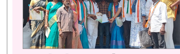
విశ్వం వాయిస్ సమావేశం అమలాపురం టౌన్