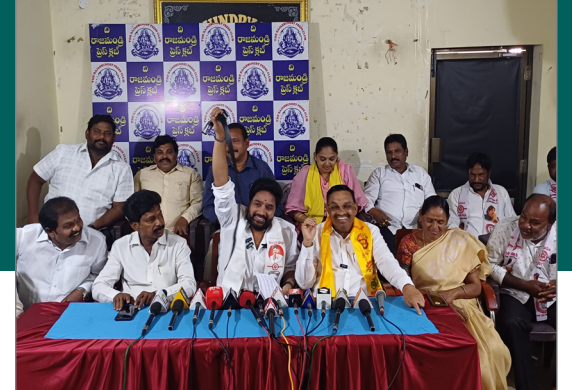
రాజమహేంద్రవరం, విశ్వం వాయిస్ సమావేశం: