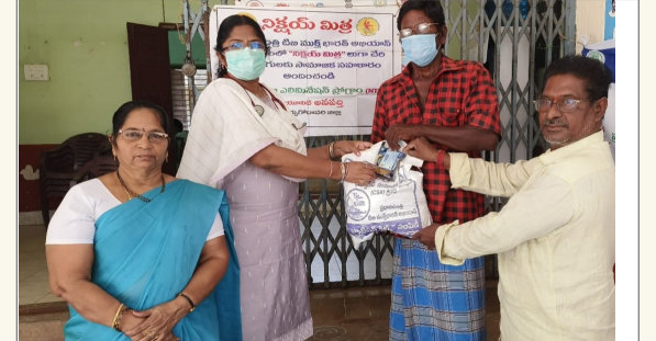
బిక్వోలు విశ్వం వాయిస్ సమావేశం