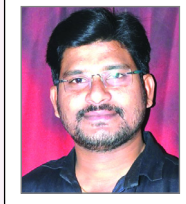
ఎడిటర్: కె. సుబ్రహ్మణ్యం

సామాజిక శాస్త్రవేత్తలు 19వ శతాబ్దపు మురికివాడలను పారిశ్రామికీకరణ ఉప-ఉత్పత్తిగా భావించారు. అభివృద్ధి చెందుతున్న దేశాలలో నేటి మురికివాడల పెరుగుదల పేదరికం, వ్యవసాయ క్షీణత కారణంగా ఏర్పడినదే.