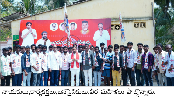
నాయకులు, కార్యకర్తలు, జనసేనకులు, వీర మహిళలు పాల్గొన్నారు.