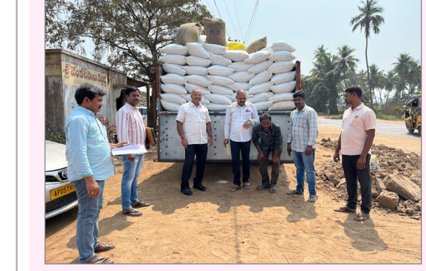
అమలాపురం విశ్వం వాయిస్ కలెక్టరేట్ సమావేశం